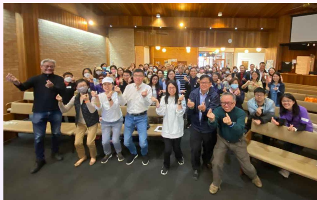
「耶穌愛悉尼」車士活出隊精兵們

今次耶穌愛悉尼由開始籌備、然後向各教會牧者分享、再推動眾弟兄姊妹參加的整個過程，實在看到是天父在背後的啟動和帶領！我們一群策動者與新成立的「愛仁勇者佈道團」一起行動，佈道團員縱然經驗不多，卻勇於承擔作小組組長的職任，他們願意謙卑學習、忠心服侍的榜樣，得到眾參加者的肯定和欣賞。他們也在參與計劃過程，並在幾週密集累積的出隊經驗中，體驗了「佈道式」門徒訓練，成為佈道領袖，更是值得感恩！但願這次耶穌愛悉尼的經驗，能成為各地短宣中心和教會的一點借鏡，以鼓勵各地華人信徒延續那顆樂傳福音的初心！