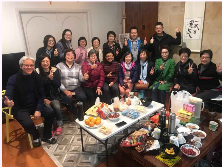
2022年成立「愛仁勇佈道團」，團員協助策劃「耶穌愛悉尼」七區遍傳，並擔任出隊組長

過往很多的佈道出隊，十分重視佈道的結果的量化數字，即完成出隊後，究竟有多少人決志信主、慕道、歸回和澄清信仰？但我們今次並無收取類似的「佈道數字」。這是因為有些佈道遍傳，過於著重決志信主等數字，反而會有誤導性，因為我們深知一個人決志信主之後，是需要長時間跟進栽培，加上很多時在遍傳中佈道者的參差，所謂佈道的決志數字容易「充滿水份」，故此我們改變這方面的策略和表達。我們記錄作參考的，著重完成多少具體的行動，例如完成多少份問卷、派出多少單張或講完福音故事多少次等。今次我們在數據上清楚看見，通常該次有多少人出隊，就會完成大概相同人數的電子問卷，而當中完成問卷的對象，大概三分之一願意留下個人資料可以繼續跟進，果效明顯。我們的策略是盡量將同教會的弟兄姊妹篇同一個二人小組中，那麼就可以避免不必要的轉介，鼓勵弟兄姊妹直接承擔跟進工作，將人領回自己的教會，這次亦有好些新朋友願意被邀到教會的見證，實在是很大的鼓舞！