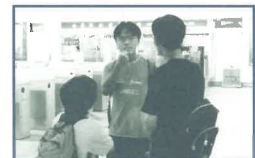
在台北市捷運地鐵站佈道(台灣短宣隊6/00)