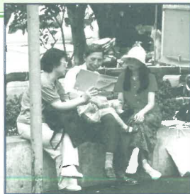
台灣短宣隊員在廈門街公園用「美滿人生」畫冊佈道(6/00)