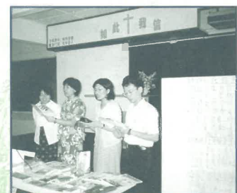
短宣隊在美里福音堂(都九及廉律分堂)分享短宣異象(6/00)