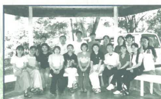
短宣隊與美里短宣中心全體學員合照(6/00)