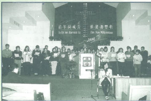
在多倫多短宣中心舉辦「華人福音運動」培靈聚會中，短宣校友們在台上獻詩，張教士帶著腳傷坐著分享信息、激發人心。(1/00)