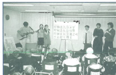
短宣隊在溫哥華華宮老人院領唱詩歌及佈道