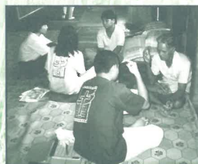
東馬SUAI土著宣教(美里短宣隊6/00)